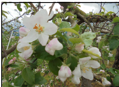
4/27 満開のふじリンゴ